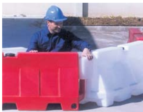
ESEMPI DI POSA IN OPERA

*BARRIERA STRADALE TIPO "JERSEY" IN POLIETILENE (CON TRATTAMENTO UV) CON SISTEMA DI COLLEGAMENTO MEDIANTE UN GIUNTO A DOPPIO INCASTRO (GBR 001).