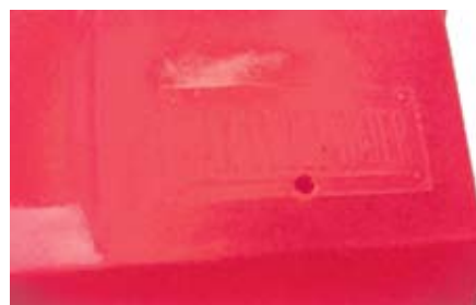
FORO DI TROPPO PIENO