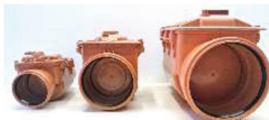
Clapet in-line con giunti di raccordo

VOCE DI CAPITOLATO : Fornitura di valvola antiriflusso di linea con sistema di chiusura di emergenza costruita in PVC, metallerie in acciaio inox , per innesto su tubi in PVC o per accoppiamento su tubi di qualsiasi materiale ( PVC, PEAD, PRFV, gres, ghisa, fibrocemento, etc ) per mezzo di giunti multidiametrali ; tappo di ispezione e pulizia ; guarnizione di tenuta in EPDM