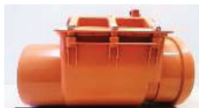
Clapet in-line ad innesto