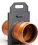
Serranda ghigliottina fognatura Sewage guillotine shuttle